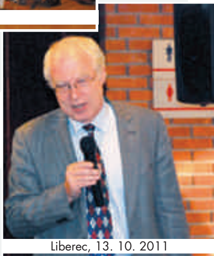
Liberec, 13. 10. 2011

Záznam z debaty najdete na: www.reformycssd.cz